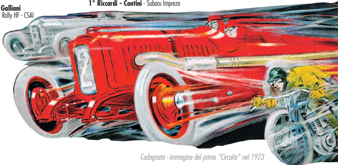
Codognato - immagine del primo "Circuito" nel 1923

Rally Nazionale Auto Storiche: 1° Musti - Granata - Porsche 911 RS